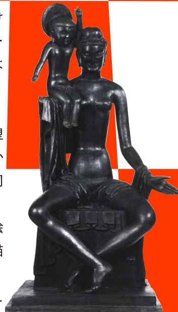
降誕の釈迦 1929年 宇都宮美術館

本展は、大正から昭和初期にかけて活躍した彫刻家陽咸二（1898—1935）の全貌を明らかにするはじめての大回顧展になります。