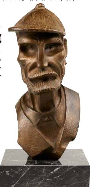
或る休職將軍の顔 1929年 東京国立近代美術館