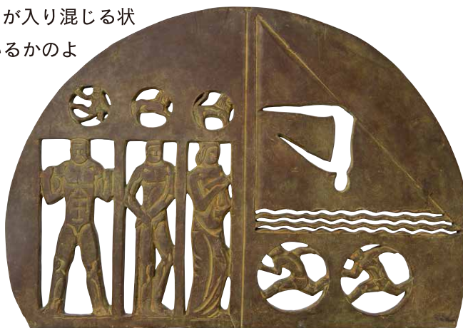
扉 1930年 個人蔵